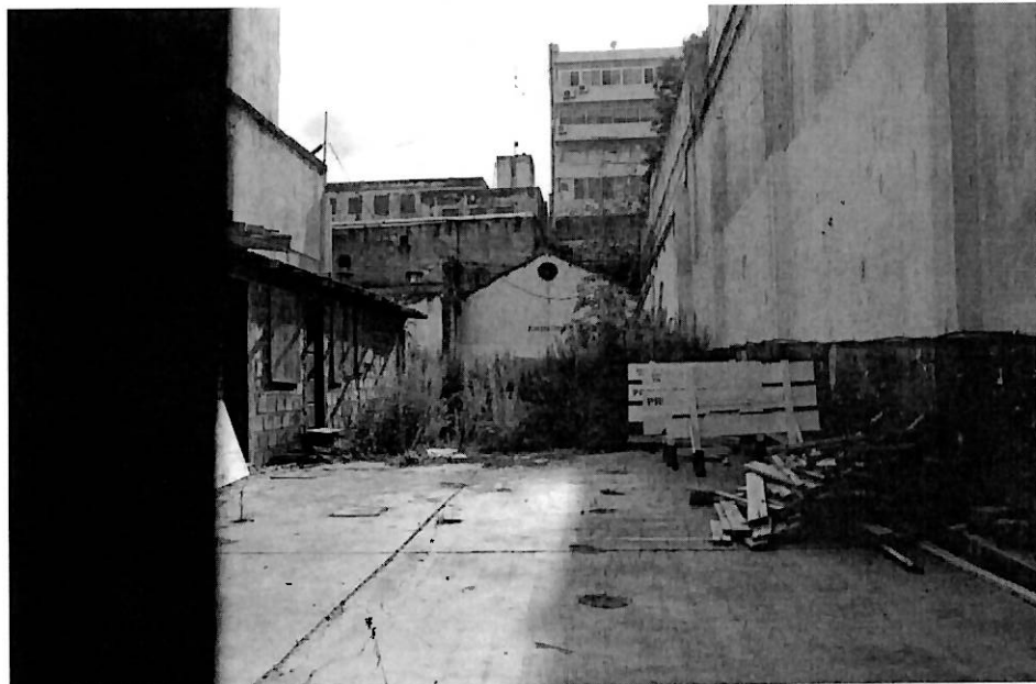
VISTA DEL INTERIOR DEL PREDIO POR HENDIDURA EN CERCO